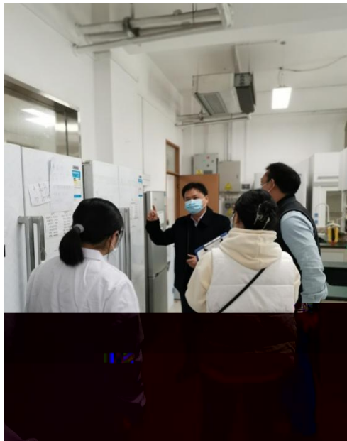
学院领导检查药物化学学部科研实验室