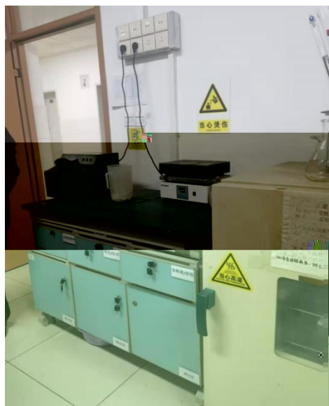
C426 实验室仪器设备标识清楚